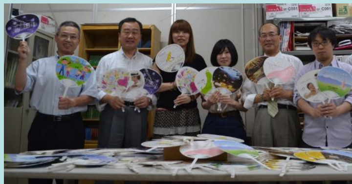
14年撮影: 仙台的うちわ工場の皆さま

関係各位、皆さまのより一層のご理解を戴き、ホスピタリティ業界のさらなる存在感を示す意味でも大きな支援プロジェクトへの参加を強くお勧めします。