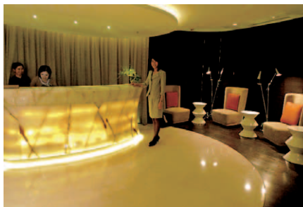
116階クラブラウンジの反対側に位置する、「The Ritz-Carlton Spa by ESPA」のレセプションホール。施設の充実度はトップクラスで、スタッフのホスピタリティー感覚も秀逸だ