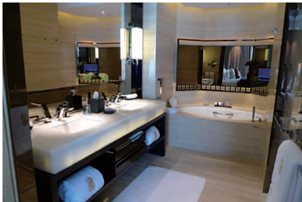
ゴージャスなバスルームである。バスタブは専用レイアウトされた奥まった場所に収まり、オーバルの形状である。パウダーコーナーは直線主体の力強さがあり、右手にトイレとシャワールームがある