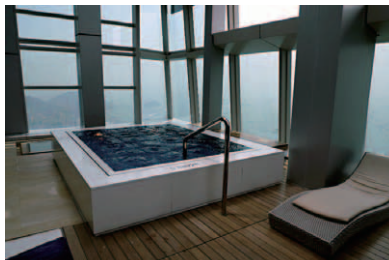
プール脇より外に出られ、このようなオープンエアのジャグジーに浸ることができる。湯加減も良く天空の露天風呂といった風情である

今回は開業後まだ2カ月もたっていない時期での訪問であり、サービス面で真価を発揮できているか一抹の不安があった。しかしホテルのブローシャに書かれている「The Ladies and Gentlemen of The Ritz-Carlton, Hong Kong welcome guests...」の通り、スタッフ全員が誇りを持って真のホスピタリティーを実践しており、特にクラブフロアスタッフのスキルは相当に高いものがあった。