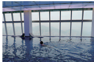
118階に位置し、まさに天空のスイミングプールである。地上490mの高さで泳ぐ爽快感はまさに異次元の世界だ