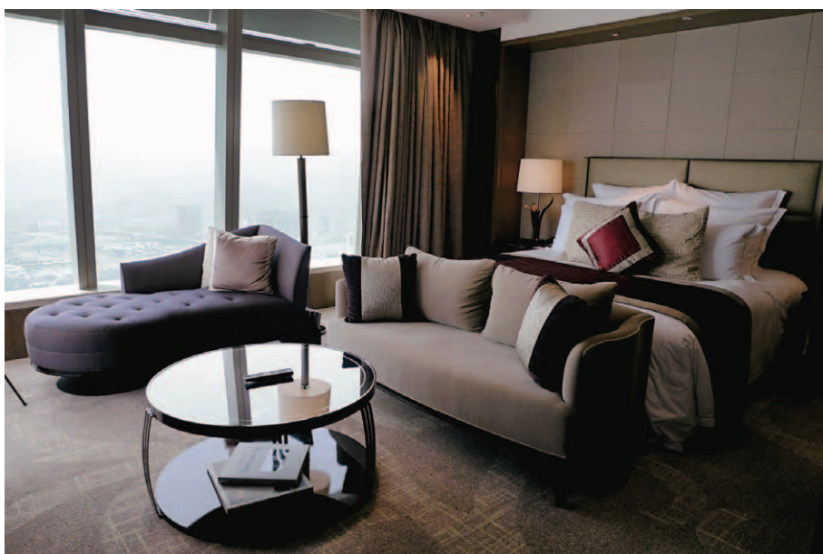
五重のピローやクッションを備えたキングベッドとシッティングエリア。写真左側がコーナーウィンドウになっており、ここから香港島を見下ろすことができる。この部屋はクラブフロアにあるアイランドビュー・ジュニアスイートで約65㎡の広さがある