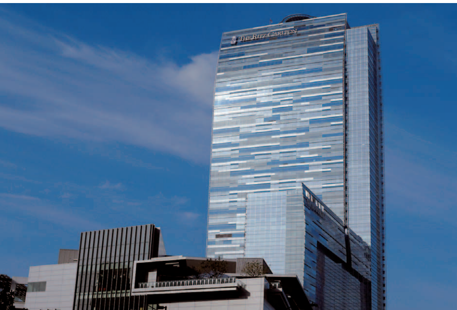
カリフォルニアの青い空にそびえる54階建てのザ・リッツ・カールトンL.A. Live。22～26階がホテル客室部分で、27～52階は総戸数224戸の超高級レジデンスが占めている