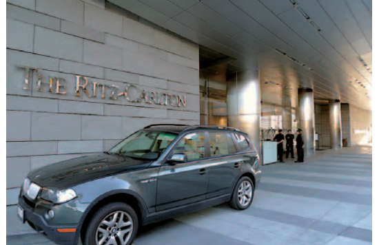
既存のリッツ・カールトンとの違いを表現するために、定番の黒地にライオンとネームの銘板ではなく、大きく斬新なデザインのロゴである