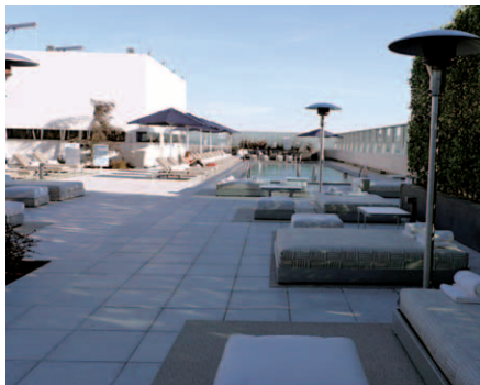
26階にあるルーフトップのスイミングプール。ちょうど最初の写真、JWマリオットのロゴ部分屋上にある。プール手前は多くの専用ベッドを備えたリラクゼーション・スペースになっている