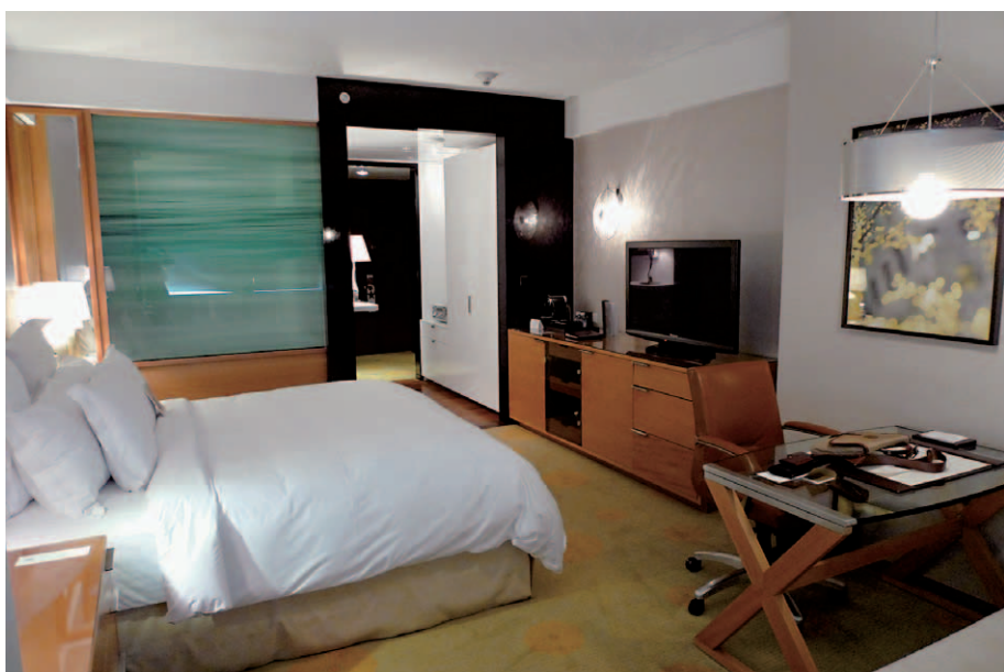
ブティックホテルの感性と5ツ星ホテルのホスピタリティーをコンセプトにした、コンテンポラリー感覚が漂う客室。この部屋はクラブフロア・デラックスの名称で約42㎡の広さがある