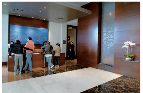
手前にソファセットがあるのだが、ブティックホテルを意識した隠れ家風のレセプションフロア。したがって大規模なロビーというものはない