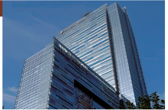
ロサンゼルスダウンタウンにある巨大複合施設、L.A. Liveにオープンした。手前にはJWマリオットの大きなロゴが見え、建物の4～21階を占めている