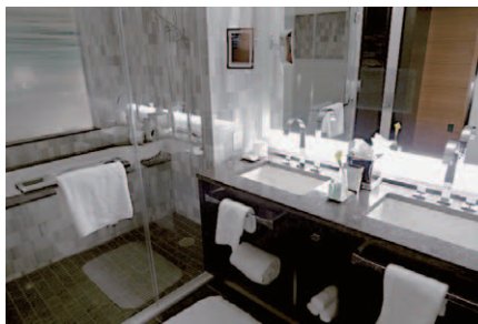
客室を特徴付けるヒップでクールな感覚のバスルーム。シャワーブースとバスタブが一体化した形状で、ビルトインのミラーTVもスマートだ