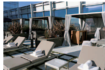
リラクゼーション・スペースには豪華なカバナもあり、ここでスパ・トリートメントも頼める