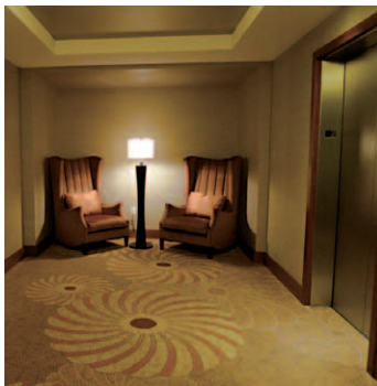
23階にあるスパ入り口前のエレベーターホール。コンテンポラリーの中にもクラシカルなリッツ・カールトンの雰囲気も残っている