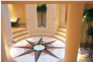
7階にある「The Peninsula Spa」館内の優雅な中央ホール