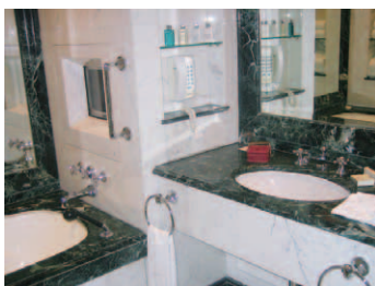
総大理石のバスルーム。バスタブには早くからビルトインのTVを導入している