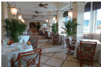
天井でゆっくり回るファンがコロニアルな雰囲気を醸し出すオールデイダイニング「The Verandah」