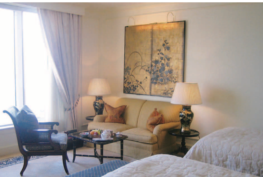
タワーウィング高層階にある客室「Grand Deluxe Harbour View Room」。部屋からは香港島の圧倒的な超高層ビル群が望める。写真は改装前の客室で、タワーウィングは今年8月に終了し、現在は旧館の改装中。来年3月に全工程が完了予定である