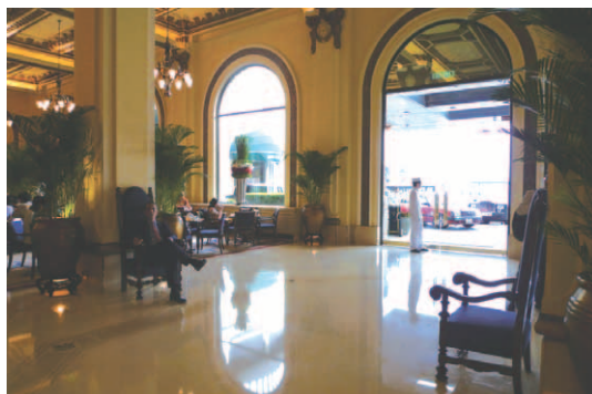
コロニアルな雰囲気のエントランスホール。お馴染みの白の制服・制帽のページボーイがにこやかにゲストを迎え入れる