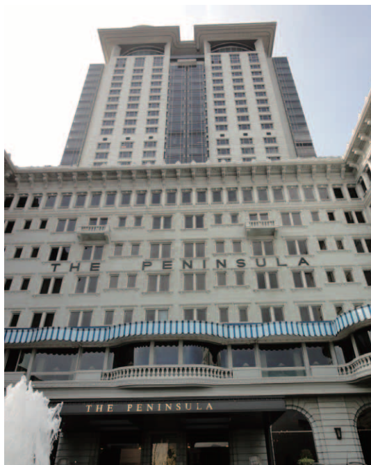
ザ・ペニンシュラ香港の正面ファサード。1994年に30階建てのタワーウィングを新設している