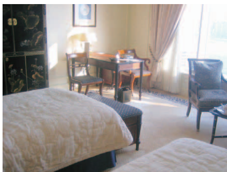
TVやガラス類が収まった厚重な中国趣味の家具とライティングデスク

これほど、その土地とホテルがあらゆる方面で密接に繋がった関係は、他に類を見ないであろう。香港を訪れた人なら誰しも、九龍半島の先端にそびえる壮麗なコロニアル建築に目を奪われるに違いない。車寄せには最新のロールスロイスが並び、正面玄関の両脇を2頭の獅子像が見守るエントランスでは、おなじみの白の制服・制帽のページボーイがにこやかにゲストを迎え入れる。ザ・ペニンシュラ香港は、この香港・九龍の土地と不可分の関係であり、まさに“香港のシンボル”と言えよう。