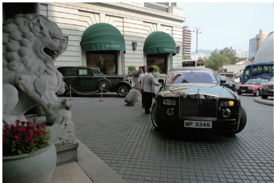
正面玄関の両側を2頭の獅子像が見守るエントランス車寄せ。最新のロールスロイス・ファントムを14台所有しており、これほどロールスが似合うホテルは他に類を見ないであろう