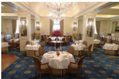
1953年から長年にわたり愛されてきた正統派フレンチダイニング「Gaddi's」