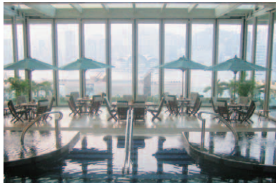
8階にあるスイミングプール。ガラススクリーンは開閉式で、テラスから香港島の摩天楼が望める