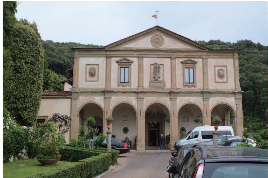
正面ファサードはイタリアルネッサンスの巨匠ミケランジェロの手により設計された。現在はイタリア政府保存委託建造物(重要文化財)に指定されている貴重な建物だ