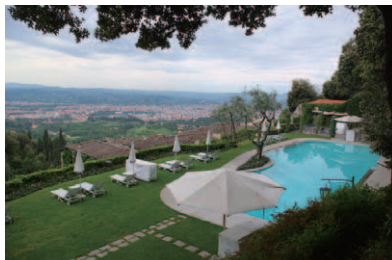
庭園の丘の上には素晴らしい眺望が得られる温水プールが用意されている