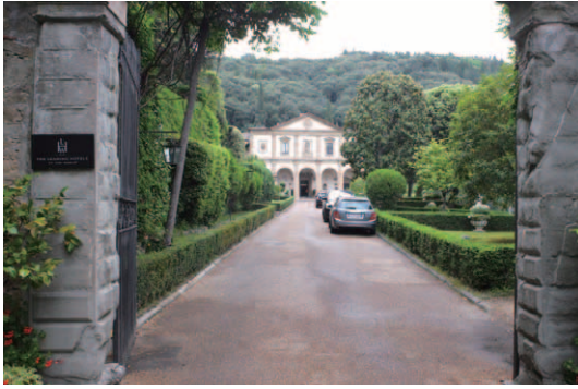
フィレンツェの市街地を見下ろすフィエーゾレの小高い丘の上に建つ「Villa San Michele」の庭園アプローチ