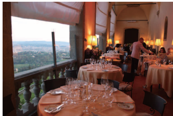
フィレンツェ旧市街の圧倒的な景色を一望できるメインダイニング「The Loggia」