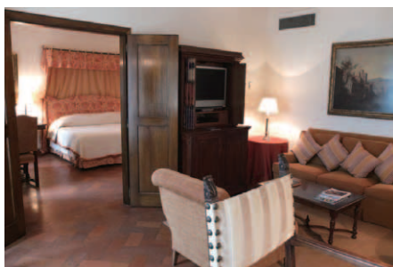
手前のゆったりとしたリビングルームと奥に見えるベッドルーム

ホテル建物の起源が15世紀初頭のフランシスコ派の修道院まで遡ると言えばビックリするであろう。さらに正面ファサードは、ルネッサンスの巨匠ミケランジェロの手により設計されたと聞けば尚更のことである。フィレンツェの中心部から車で20分の郊外、市街地を見下ろすフィエゾレの小高い丘の上にヴィラ サンミケーレは建ち、その重要文化財にも指定されている白亜の歴史的ホテルがゲストを温かく迎え入れてくれる。館内随所に見られる内装に施された彫刻、壁や天井に描かれたフレスコ画、見事なアンティーク家具の数々は壮麗で優雅な雰囲気に満ちている。ゲストはあたかも有名な大聖堂や美術館に居るような錯覚を感じ、そこに悠久で孤高の美しさを見出すことができる。