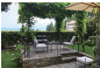
ヴィラスイート玄関から俯瞰した専用ガーデンのテラス部分