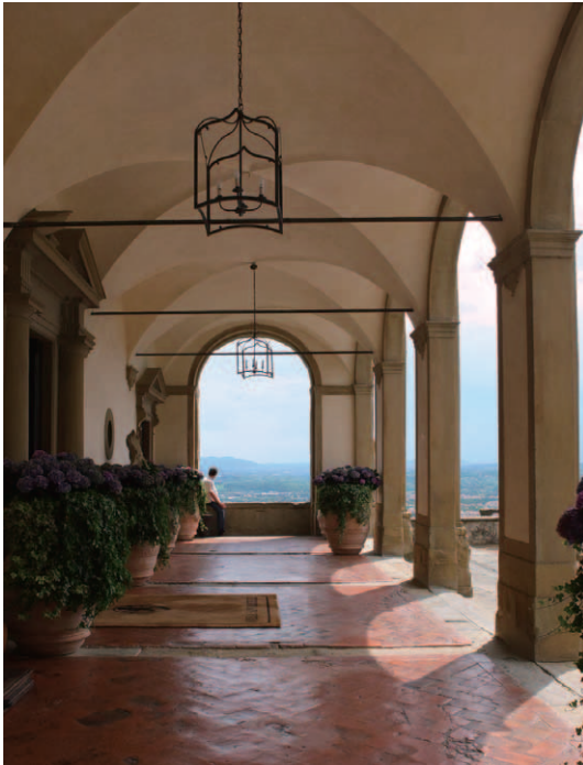
正面エントランス前の歴史を感じさせる回廊。ホテル建物の起源は15世紀のフランシスコ派の修道院まで遡る