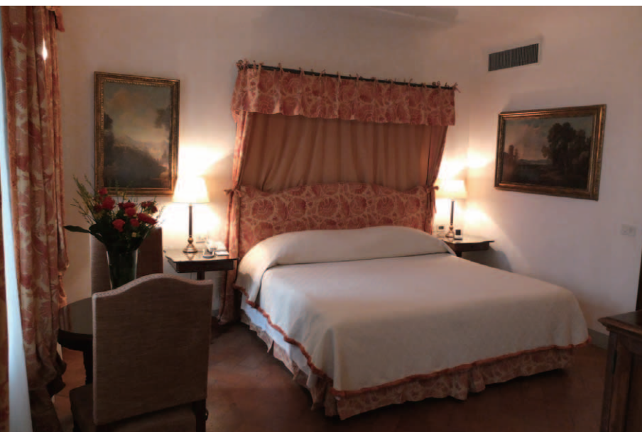
4つあるヴィラスイートの1つ「The Garden Suite」のベッドルーム。フィレンツェの市街を望む専用ガーデンが付随しており約75㎡の広さを有している