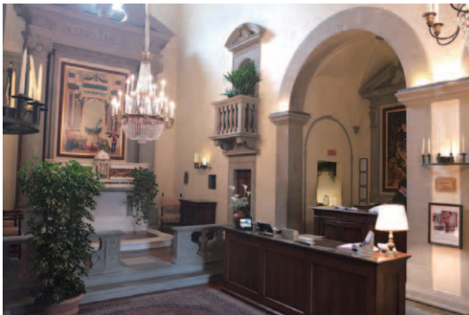
かつての礼拝室の祭壇であった場所に隣接してレセプションデスクが置かれている