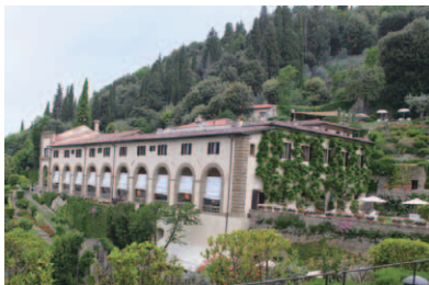
修道院当時の面影が色濃く残るホテル本館の横側部分