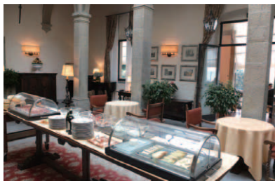
トップライトからの陽光が気持ち良い大広間。朝食時にはbuffetの幅広い料理が並ぶ