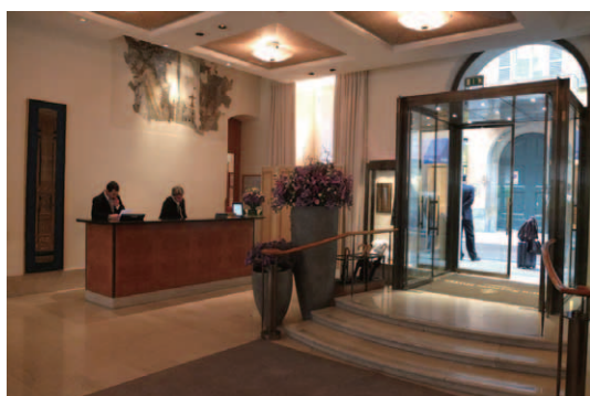
建物内エントランスホールから見た正面玄関とコンシェルジュデスク。デスク背後の壁面にフレスコ画の一部が保存されている