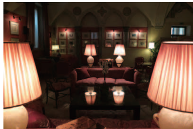
その奥にある落ち着いた雰囲気のリウンジ・バー「Il Foyer」