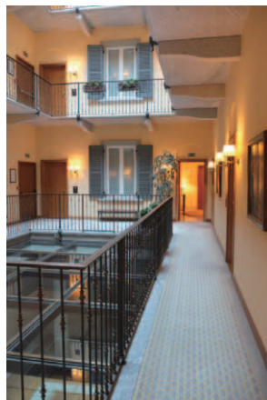
天窓からの光が差し込むパティオを中心とした別ウイング廊下

歴史ある市街地に取り残された中世の古い僧院や修道院を高級ホテルとして再利用させる、フォーシーズンズ流のホテル改修・再生術の先鞭をつけたホテルといえよう。ホテル建物は15世紀の尼僧院がルーツで、増改築を繰り返しながら18世紀には現在の規模の修道院になったという。イタリアファッションの中心地ミラノで、高級ブティックが軒を並べるモンテ・ナポレオーネ通りから1本奥に入ったジェズ通りにある、まさに最高のロケーションを誇る立地だ。これまでの歴史と格を誇るいわゆるグランドホテルの一群を抑えて、ミラノでいちばんのファッションナブルな人気ホテルとなり、後に続くデザイナーズ系のブルガリホテルやアルマーニホテルの先駆けとなったホテルといえる。