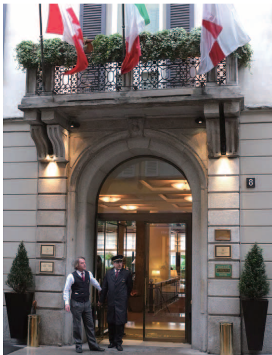
高級ブティックが軒を並べるモンテ・ナポレオーネ通りから1本奥に入ったジェズ通りにある控えめなホテル正面玄関