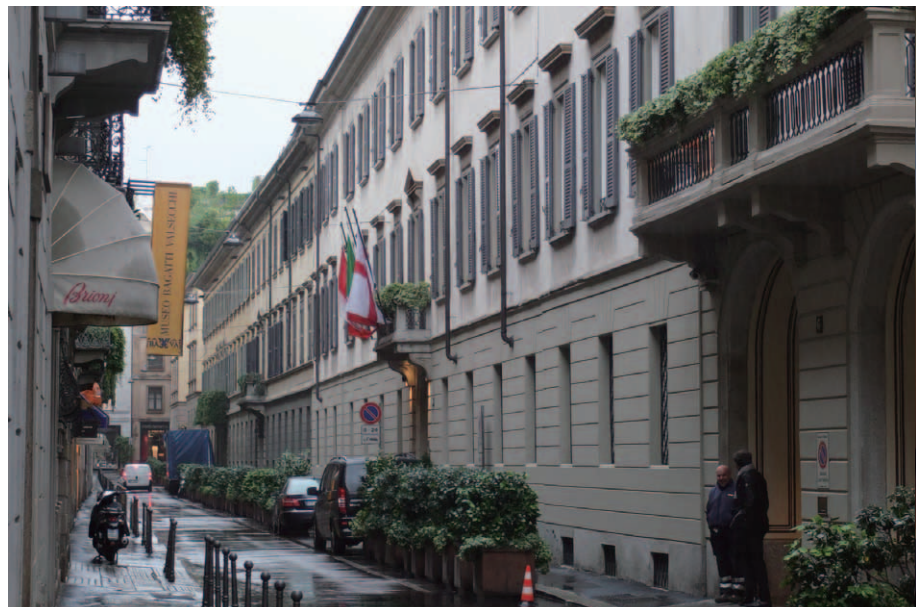
建物は15世紀の尼僧院がルーツで、いかにもイタリアらしい車一台がやっと通れるくらいの狭いジェズ通りに「Four Seasons Hotel Milano」のエントランスがある

ホテルジャーナリスト。 慶応義塾大学法学部法律学科卒。74年 Munich Re入社。85年築地原健株代表取締役。2001年投資顧問会社原健設立、代表取締役CEO。JHRCA、日本ホテルレストランコンサルタント協会理事。 ※現在、著者のホームページで「世界のリーディングホテル」を連載中。多くの美しい写真と興味深いコメントで、世界中のホテルとそれら関連都市を紹介。 www.jhrca.com/worldhotel