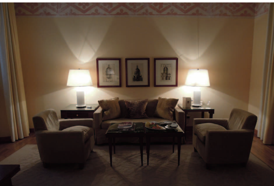
レセプションの先にある別ウイングに位置する「Four Seasons Executive Suite」。このスイートルームは約70-84㎡の面積があり、広々としたワードローブ室と浴室を備えている