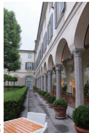
中庭を取り巻く修道院当時の面影を残す「クロイスター」[列柱廊]は絵のような美しさだ