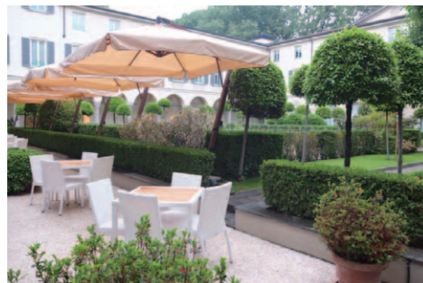
「La Veranda」前面のテラス席と回廊に囲まれた中庭