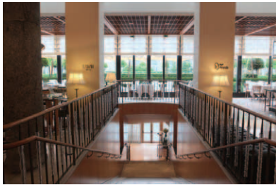
正面に「La Veranda」、階段を下がるとイタリア料理イル・テアトロ「Il Teatro」がある