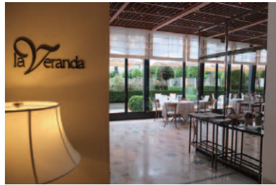
オールデイダイニングのラ・ベランダ「La Veranda」のエントランス