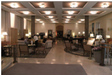
エントランスホールに広がるロビーラウンジ「Camino Room」