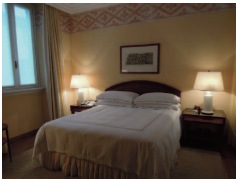
スイート奥にあり左右に窓を持つ落ち着いたベッドルーム